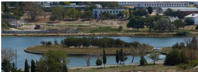
Рис. 2. Место обретения мощей святого Климента (островок в вершине Казачьей бухты)