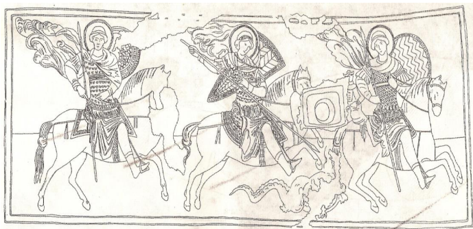
Рис.1. Эски-Кермен. Фреска храма Трёх всадников. Прорись фрески по О. И. Домбровскому

В XIII в. христианство на земле средневекового Крыма сформировалось как господствующая конфессия, а обитатели, исповедующие Православие, были многочисленными. Вместе с христианством Таврика эпохи высокого средневековья получила уже устоявшийся образ Церкви в его консервативном классическом понимании и сложенном учении.