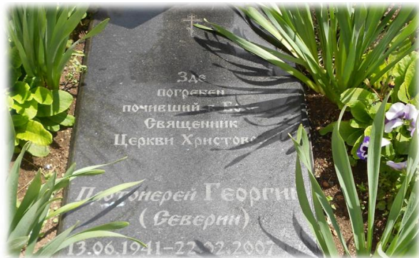
Рис 1. Место упокоения прот. Георгия Северина (за восточной, алтарной частью семинарского Храма Трех Святителей, в центре г. Симферополя)

Верим, что ныне отец Георгий находится в вечной славе Бога нашего. Да упокоит Господь душу усопших в селениях праведных!