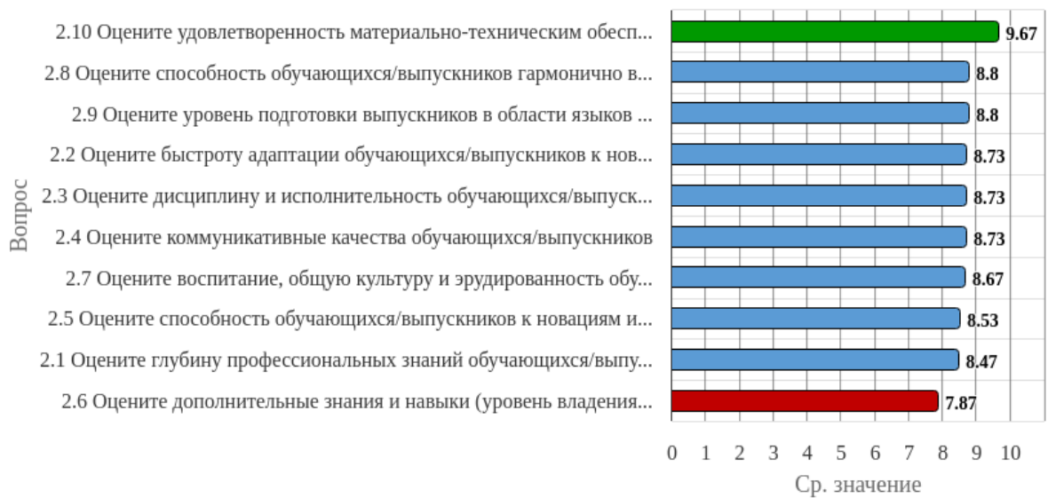
Рисунок 1.2 - Распределение показателей уровня удовлетворённости работодателей по блоку вопросов «Удовлетворённость качеством подготовки выпускников»

Индекс удовлетворённости по блоку вопросов «Удовлетворённость качеством подготовки выпускников» равен 8.7.