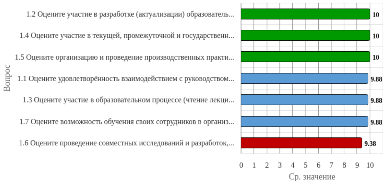
Рисунок 1.1 - Распределение показателей уровня удовлетворённости работодателей по блоку вопросов «Удовлетворённость взаимодействием с вузом»

Индекс удовлетворённости по блоку вопросов «Удовлетворённость взаимодействием с вузом» равен 9.86.