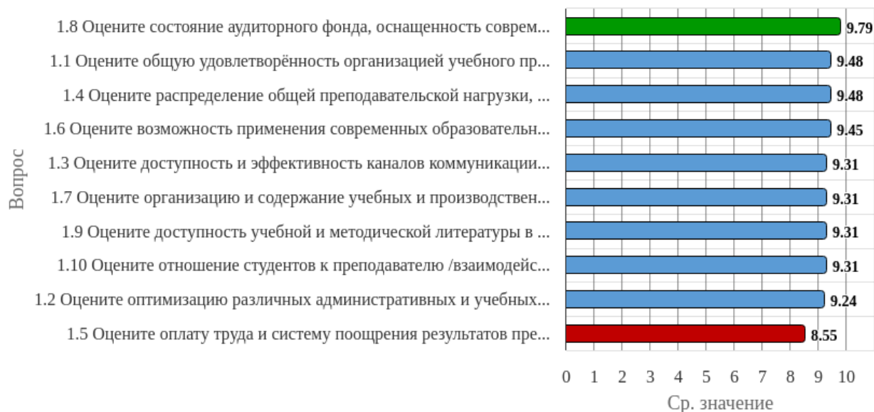
Рисунок 1.1 - Распределение показателей уровня удовлетворённости по блоку вопросов «Удовлетворённость организацией учебного процесса»

Индекс удовлетворённости по блоку вопросов «Удовлетворённость организацией учебного процесса» равен 9.32.