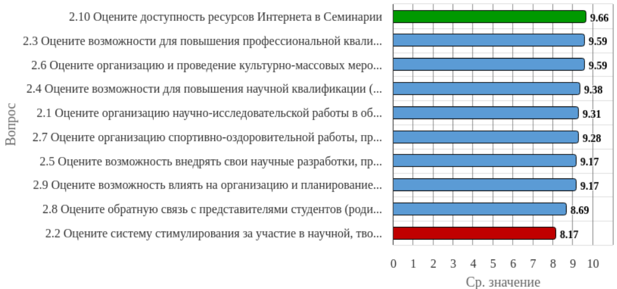
Рисунок 1.2 - Распределение показателей уровня удовлетворённости по блоку вопросов «Удовлетворённость организацией внеучебной, научной деятельности, возможностью повышения квалификации»

Индекс удовлетворённости по блоку вопросов «Удовлетворённость организацией внеучебной, научной деятельности, возможностью повышения квалификации» равен 9.2.