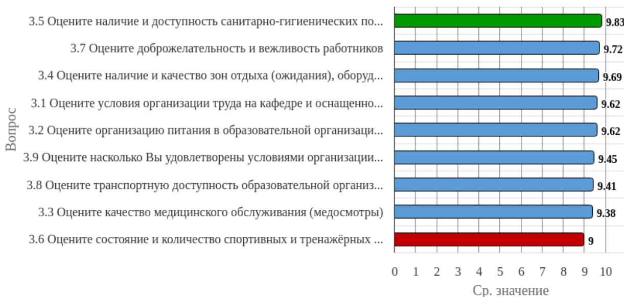
Рисунок 1.3 - Распределение показателей уровня удовлетворённости профессорско-преподавательского состава по блоку вопросов «Удовлетворённость социально-бытовой инфраструктурой вуза»

Индекс удовлетворённости по блоку вопросов «Удовлетворённость социально-бытовой инфраструктурой вуза» равен 9.52.