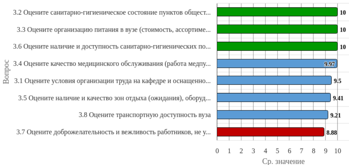
Рисунок 1.3 - Распределение показателей уровня удовлетворённости преподавателей по блоку вопросов «Удовлетворённость социально-бытовой инфраструктурой вуза»

Индекс удовлетворённости по блоку вопросов «Удовлетворённость социально-бытовой инфраструктурой вуза» равен 9.62.