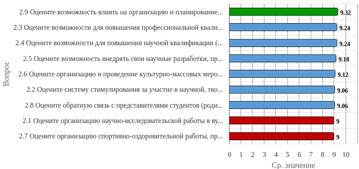
Рисунок 1.2 - Распределение показателей уровня удовлетворённости преподавателей по блоку вопросов «Удовлетворённость организацией внеучебной, научной деятельности, возможностью повышения квалификации»