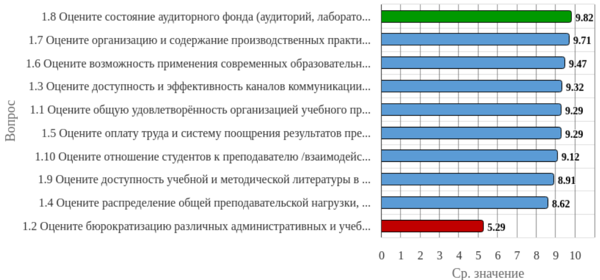
Рисунок 1.1 - Распределение показателей уровня удовлетворённости преподавателей по блоку вопросов «Удовлетворённость организацией учебного процесса»

Индекс удовлетворённости по блоку вопросов «Удовлетворённость организацией учебного процесса» равен 8.89.